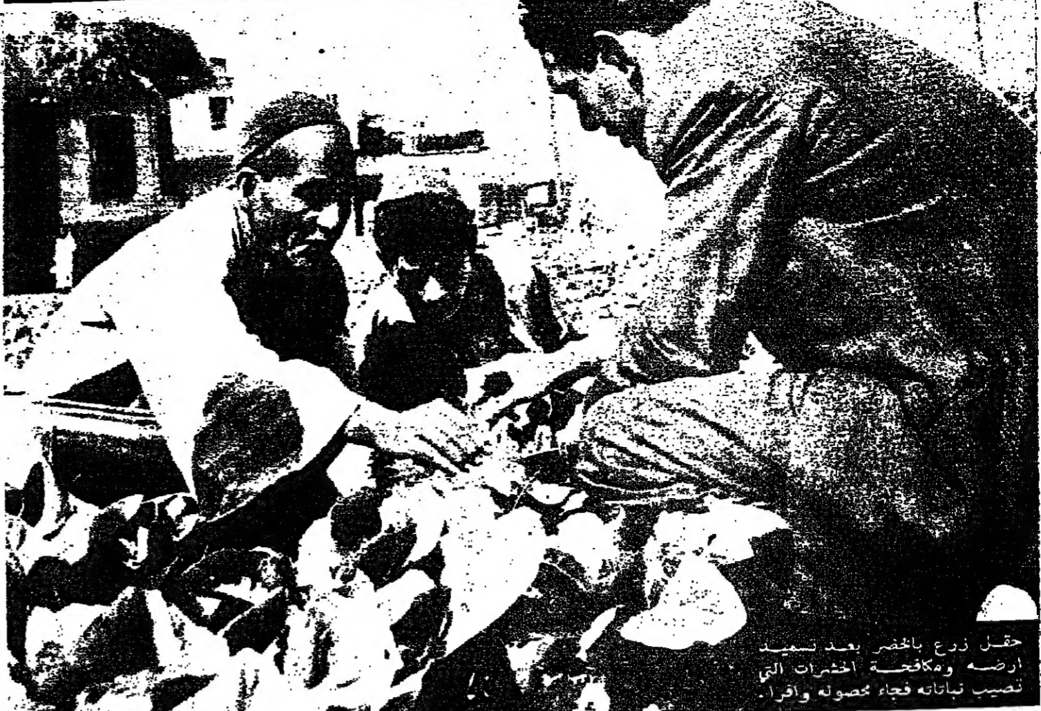
تحل زرع الخضراوات بعد تسميد ارضه ومكافحة الحشرات التي تصيب نباتاته فجاء محصوله وافرا.

زراعة الخضراوات والبقول وكيفية العناية بها هما من اهم فروع البستنة ، وعليها يعتمد الكثير من سكان الكرة الارضية لتكسب معاشهم وعائلاتهم اجسادهم . فهناك مثلا نسبة عالية من سكان المناطق المعتدلة تعتمد على اكل البطاطا اكثر من اعتمادها على الحبوب ، في حين ان سكان المناطق الاستوائية يعتمدون على البطاطا الحلوة و (الكسالة) و (اللياس) كثيرا ، ويكاد الفرد منهم لا تدخل فيه لقمة واحدة من الخبز طوال السنة . أما سكان اميركا الوسطى والجنوبية فيعتمدون اكثر ما يعتمدون على الفاصوليا لتأمين البروتينات اللازمة لاجسادهم .